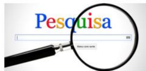
Figura 5: Pesquisa em rede