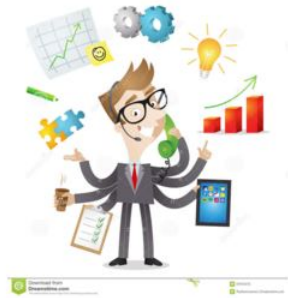
Figura 4: Multitarefa